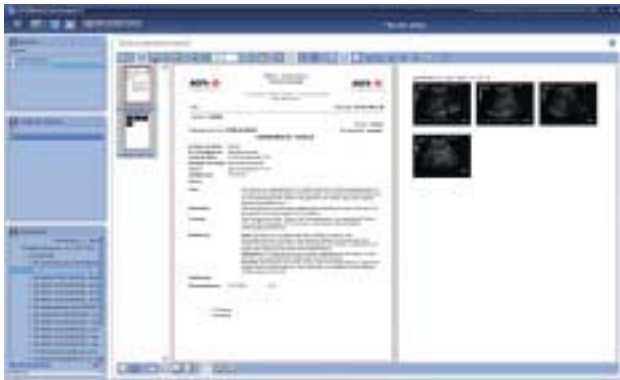
Fig. 1 | Acquisition et archivage à valeur probante