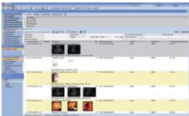
Fig. 3 | Intégration transparente d'HYDMEDIA G5 dans le dossier patient

comment accéder à l'information au bon moment et en tout lieu