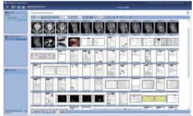
Fig. 2 | Une vue complète de tous les documents du dossier patient